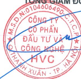
Trần Hữu Đông