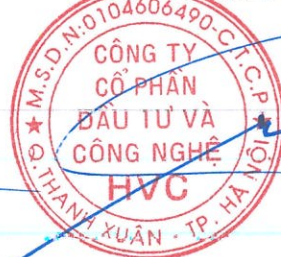
Trần Hữu Đông