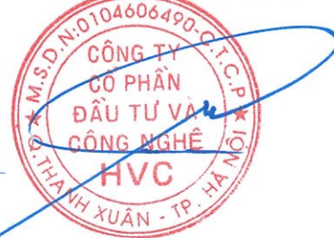
Trần Hữu Đông