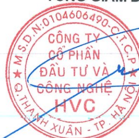
Trần Hữu Đông