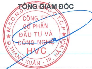
Trần Hữu Đông